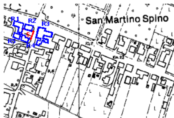
Fig. 2: Cartografia indicante i ricettori sensibili presenti

Di seguito raffiguriamo la pianta semplificata dell'evento con i punti ricettori (R1, R2, R3 e R4).