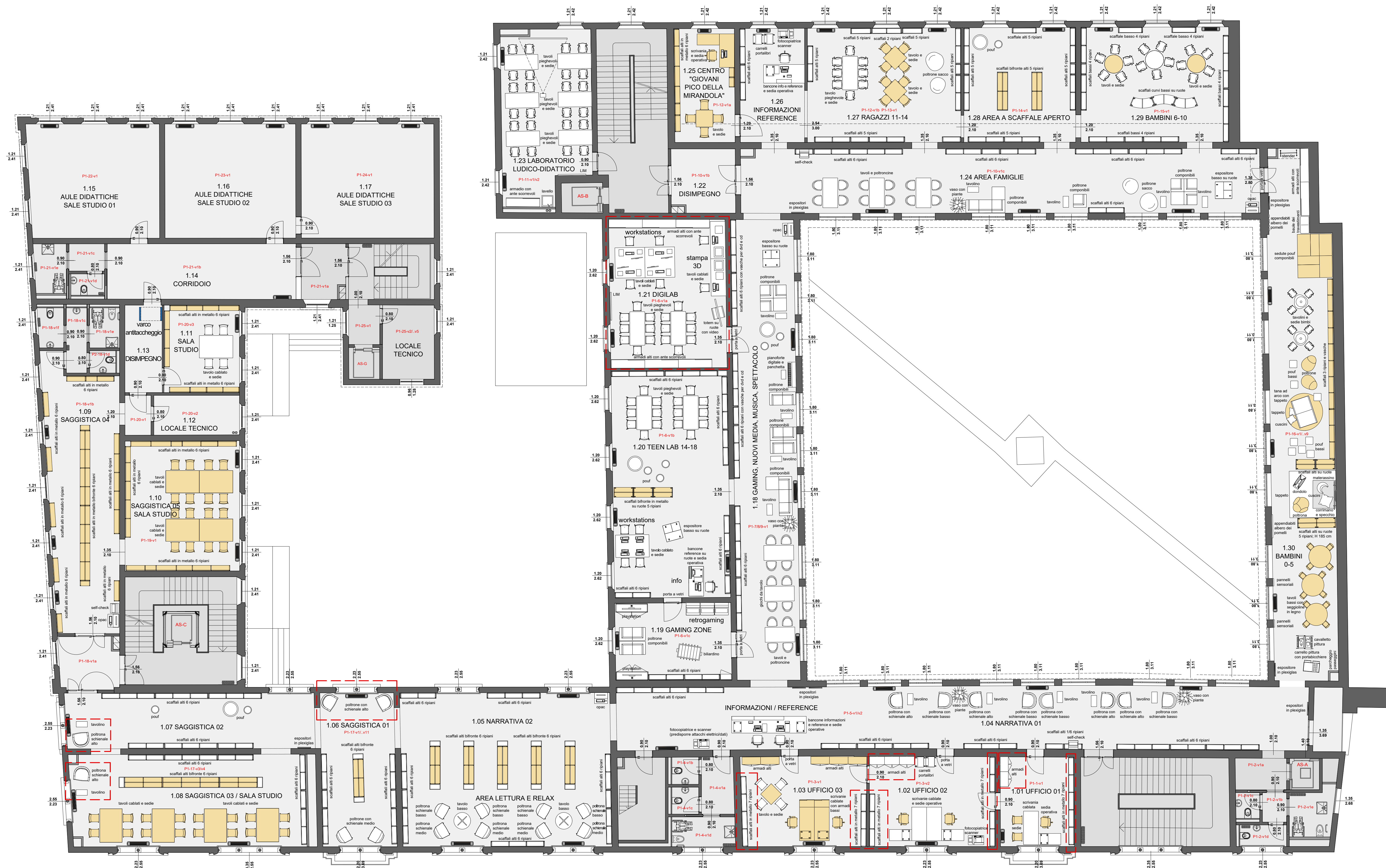
PIANTA ARREDATA PIANO PRIMO scala 1:100