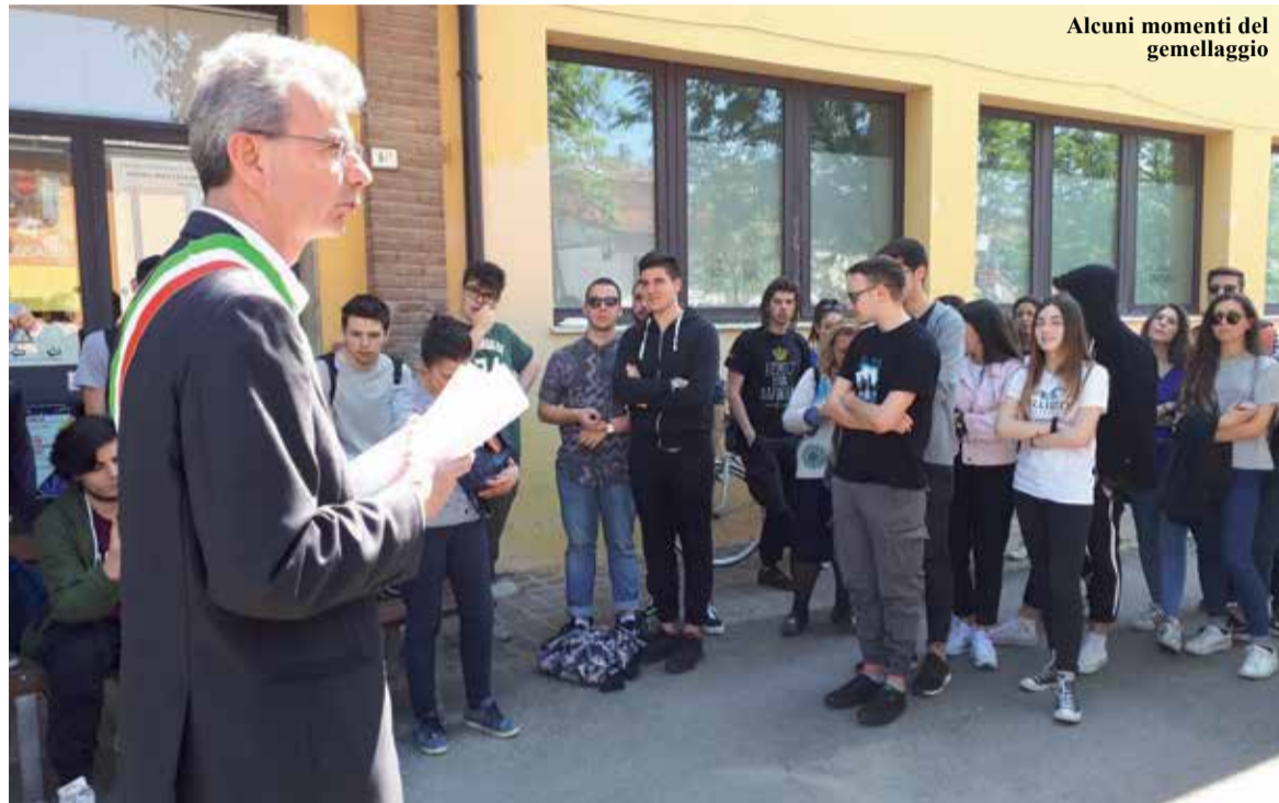
Alcuni momenti del gemellaggio