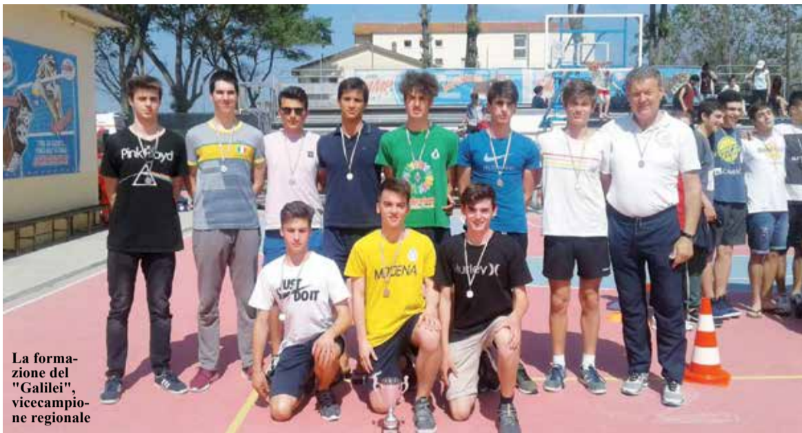
La formazione del "Galilei", vicecampione regionale

La squadra di pallavolo maschile ottiene un ottimo secondo posto a Cesenatico