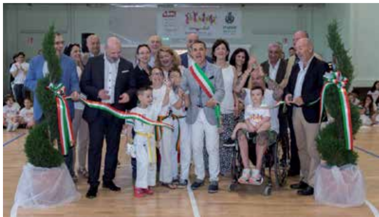
la recente inaugurazione del palasport di Medolla, ristrutturato dopo il sisma

La ricostruzione ha riguardato anche tremila tra fabbriche e aziende agricole