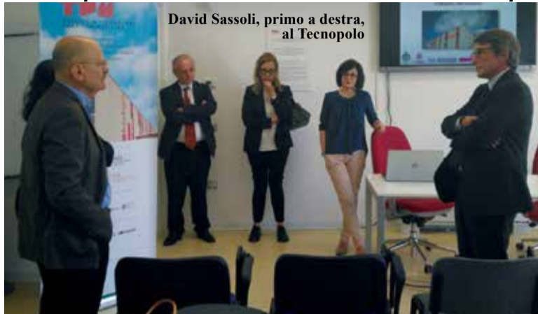
David Sassoli, primo a destra, al Tecnopolo

Il vicepresidente del Parlamento europeo è stato al Tecnopolo e all'Haemotronic