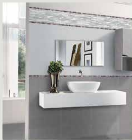
MATERIALI DI 1° SCELTA E ATTUALE PRODUZIONE