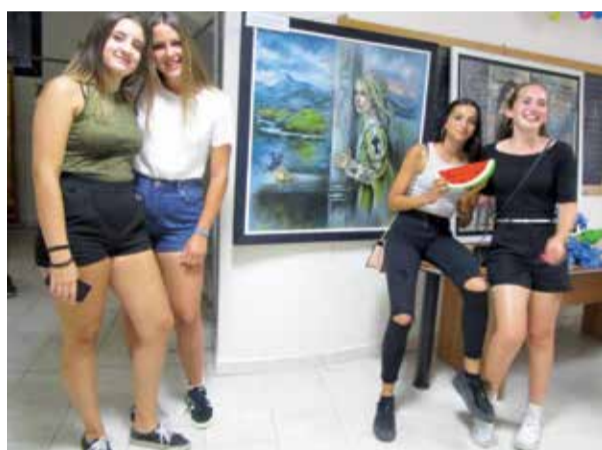
Sopra, la scultura prima classificata. A sinistra altre opere con ragazze che hanno partecipato alla Sagra

Sono state circa 140 le opere esaminate al 52esimo concorso di pittura e scultura che si è svolto a San Martino Spino in occasione della Sagra del Cocomero. Medio-alto il livello delle opere partecipanti con