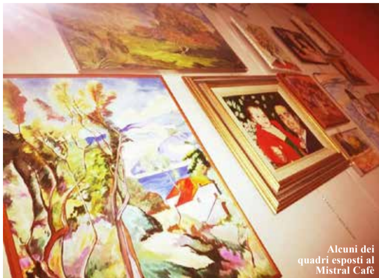
Alcuni dei quadri esposti al Mistral Cafè

Per tutto il mese di settembre sarà esposta l'emozionante mostra d'arte "Remember Us" al Mistral Cafè di Mirandola (zona Conad). Picia è la firma dell'artista misteriosa su queste tele piene di ricordi e sentimenti. Appassionata di arte, ha frequentato molti corsi della zona per approfondire diverse tecniche tra cui l'olio su tela. Introversa e delicata, la sua traccia sulle opere le rende espressione del sentimento profondo e reale che lega l'artista al soggetto del quadro. Condividendo immagini e flashback del proprio passato con gli spettatori, ottiene la rottura della quarta parete immaginaria che divide l'osservante dall'osservato. La particolarità delle tele esposte al Mistral Cafè risiede nella contemporaneità data attraverso il virtuosismo di stili e profondità. La stesura del colore rivela l'urgenza di catturare un'impressione di luce o uno stato d'animo. Le foto, che immortalano