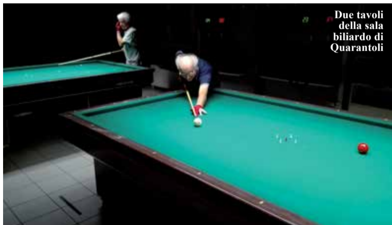
Due tavoli della sala biliardo di Quarantoli