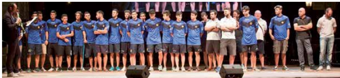
Due delle società premiate al Galà dello sport 2016: Folgore (sopra) e Khorovodarte (sotto)