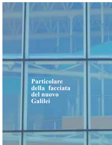
Particolare della facciata del nuovo Galilei

A finanziare la ristrutturazione, Fondazioni bancarie, Barilla e Provincia