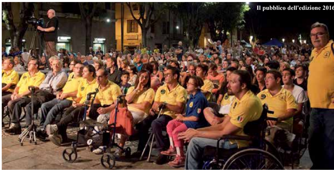
Il pubblico dell'edizione 2016