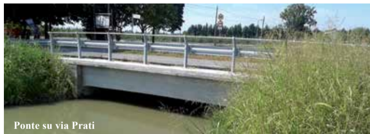
Ponte su via Prati

Il Comune di Mirandola, a seguito dei recenti avvenimenti di Genova, ha deciso un'ispezione dei circa 50 ponti comunali, già oggetto di verifica e, in qualche caso, di intervento dopo il sisma del 2012. Il risultato del monitoraggio è oggetto di una lettera che il Comune ha inviato al Ministero delle Infrastrutture e dei Trasporti-Provvveditorato interregionale per le Opere Pubbliche, alla Regione Emilia-Romagna e alla Provincia di Modena.