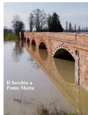
Il Secchia a Ponte Motta

Cavezzo sarà coinvolta in una serie d'importanti progetti volti a valorizzare le realtà territoriali nei pressi del fiume Secchia. In occasione del prossimo Consiglio comunale, che si terrà a fine settembre, sarà discussa l'approvazione di un progetto di paesaggio naturalistico protetto in cui si vogliono includere tutti i Comuni del Reggiano e del Modenese che si affacciano sul Secchia. Un tema, quello del progetto, di cui si è parlato giovedì 6 settembre, in occasione di una serata informativa rivolta alla cittadinanza. Nel corso di questo incontro i partecipanti sono stati aggiornati in merito a varie tematiche legate al fiume, tra cui anche la manutenzione delle arginature e gli interventi effettuati su Ponte Motta lo scorso anno.