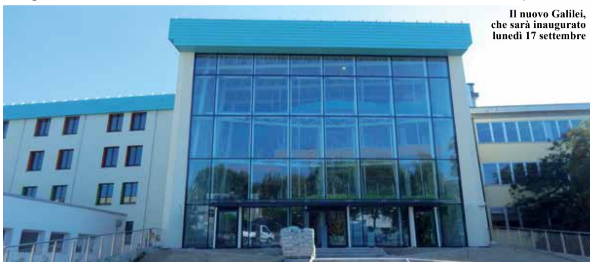
Il nuovo Galilei, che sarà inaugurato lunedì 17 settembre