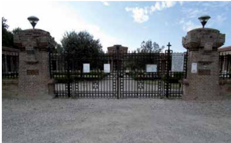
Lavori alla tribuna del campo sportivo "Borsari" di Cavezzo e, a destra, l'ingresso del cimitero di Motta. Sotto, due immagini dell'ex municipio