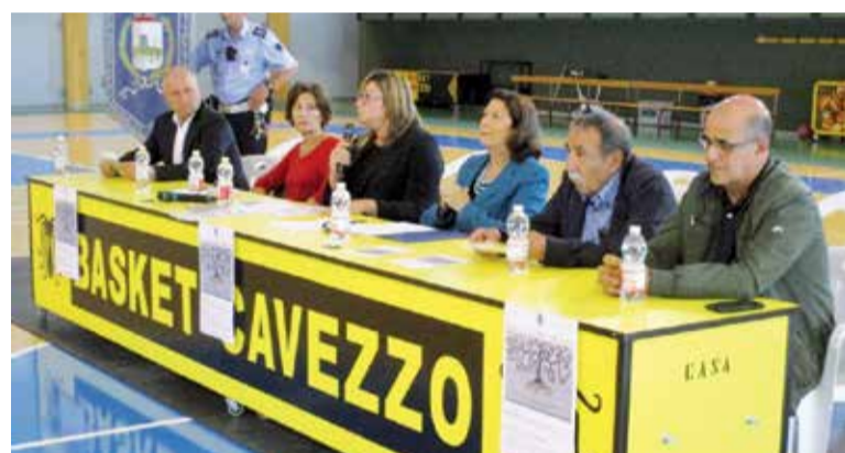
Pino Puglisi (incrocio via Moro e via di Vittorio) alla presenza di famigliari e amici delle vittime. Nel pomeriggio,

Quattro rotatorie e un parco pubblico di Cavezzo sono stati intitolati a vittime della criminalità organizzata. La cerimonia ha avuto luogo la mattina di domenica 2 settembre e rientrava nell'ambito di un'iniziativa organizzata dal Comune in collaborazione con il gruppo scout Agesci Cavezzo 1 dal titolo "Cavezzo per la cultura della legalità". Una targa dedicata a Paolo Borsellino , Giovanni Falcone , Francesca Morvillo e agli agenti delle scorte è stata collocata nel parco di via Libertà. Intitolate anche quattro rotonde a Giovanni Domè (incrocio tra via per Concordia, via Dosso e via Zappellazzi), Peppino Impastato (rotonda del polo scolastico), Giuseppe Tizian (incrocio via Cavour e via Moro) e don