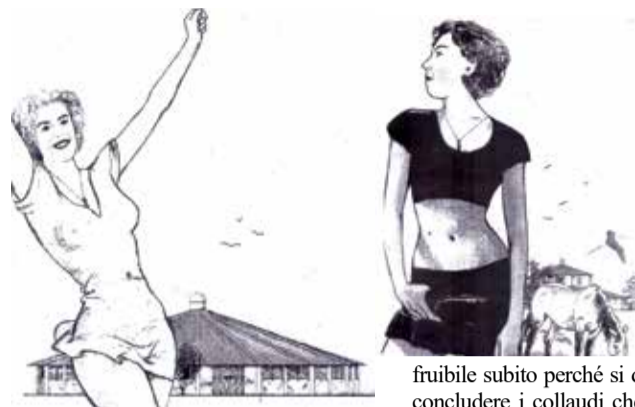
I Barchessoni in due disegni di Sergio Poletti

Alla fine di settembre l'opera sarà completata per effettuare i necessari collaudi