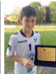
Atleta della Stadium con la targa ricevuta dalla società nel 2017. Sotto, il ju jitzu premiato nel 2016