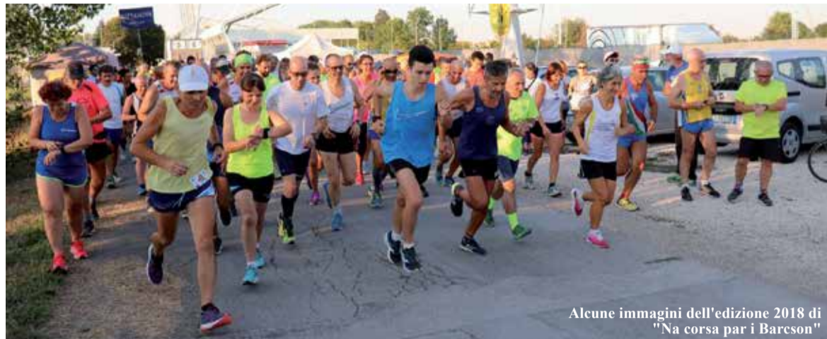
Alcune immagini dell'edizione 2018 di "Na corsa par i Barcon"

Lo scorso 21 agosto si è svolta a San Martino Spino la quinta edizione della corsa podistica non competitiva "Na corsa par i Barcon", organizzata da Sagra del Cocomero e associazione "Corri per Mirandola".